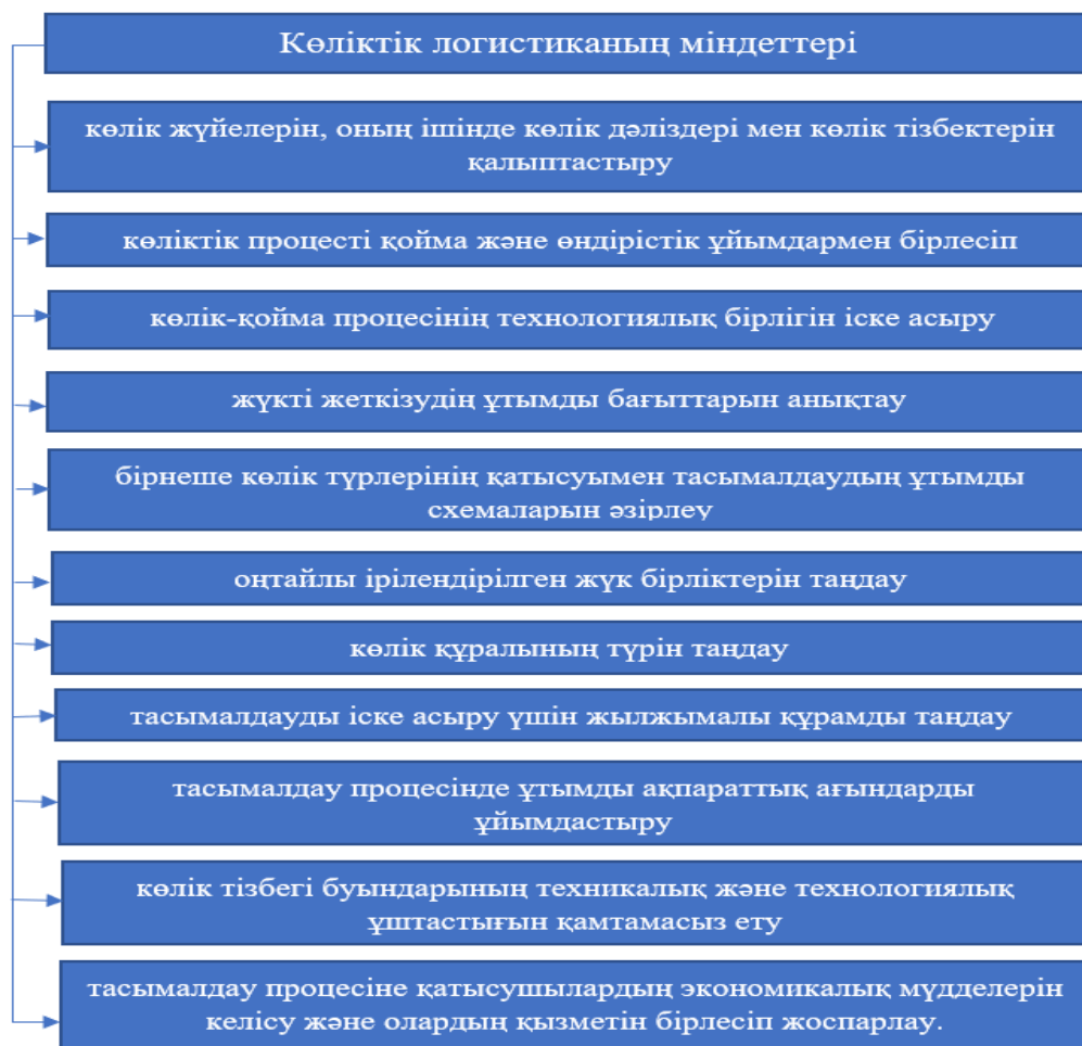
Сурет. 1 Көліктік логистиканың міндеттері

-Көліктік логистика жеткізудің тасымалдау процесін жоспарлауды қоймалық және өндірістік ұйымдармен келісу арқылы жүзеге асырады.