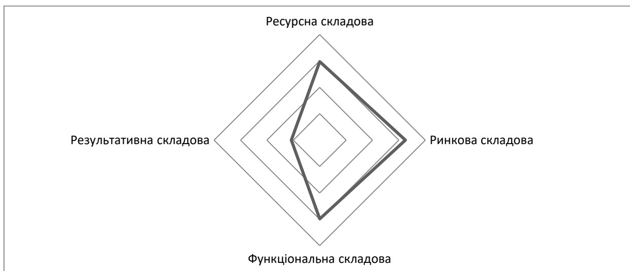
Рис. 1. Усереднений чотирикутник потенціалу АТ «Альфа-Банк» за 2017-2019 роки

Для проведення комплексної характеристики банківського потенціалу АТ «Альфа-Банку» за 2017-2019 роки та порівняльної оцінки його рівня з рівнем банків-еталонів у галузі на основі даних проведених досліджень, проведено розрахунки середнього значення векторів (рис. 1).